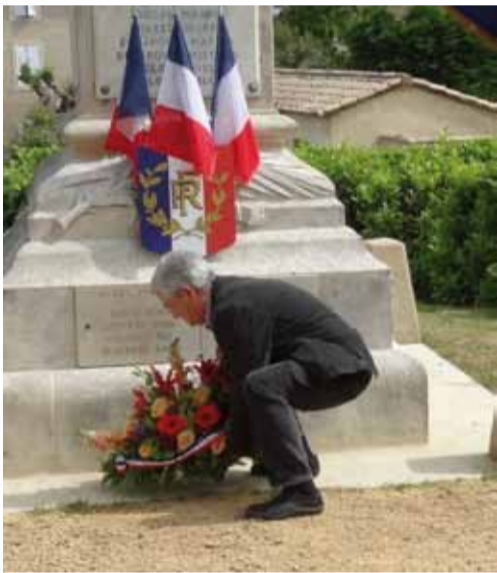
Afin de commémorer le soixante-neuvième anniversaire de la victoire

mettant fin à la seconde guerre mondiale, les Peyrolais se sont réunis au monument aux morts.