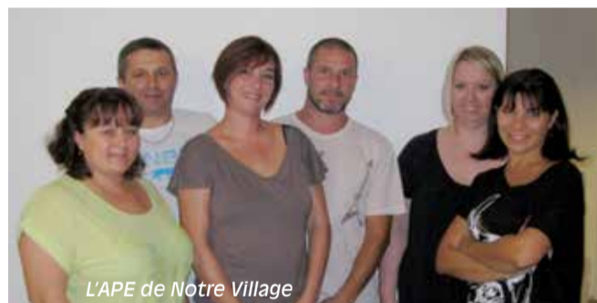
L'APE de Notre Village

l'école dans le cadre de la semaine du goût, le spectacle de Noël, une sortie cinéma, la classe verte, et la sortie de fin d'année au zoo de Peaugre.